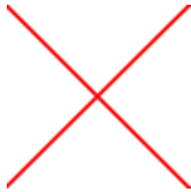
Fig. 2.2 –